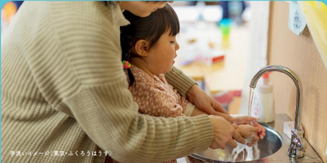
手洗いイメージ(東京・ふくろうはうす)